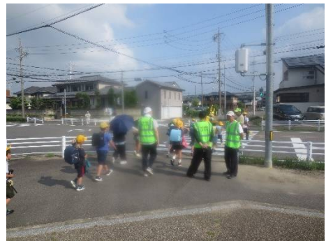
道風公園線と道風線の交差点