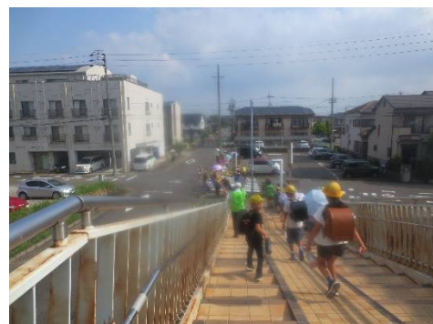
環状2号線の陸橋から小野小学校方面へ