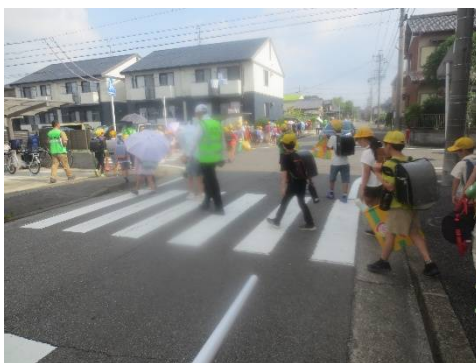
小野小学校手前の横断歩道